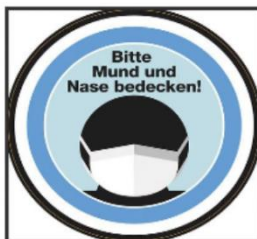
Maskenpflicht außer am Sitzplatz!