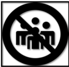
Geltende Kontaktbeschränk- ungen beachten!