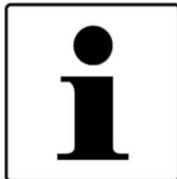
Kontaktdaten aller Gäste werden erfasst